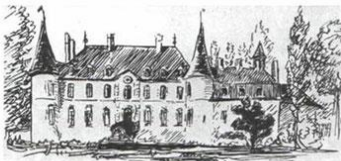
Куртавнель. Дом Полины Виардо. Рисунок Полины Виардо