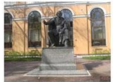
Памятник И. С. Тургеневу на Манежной площади в Санкт-Петербурге