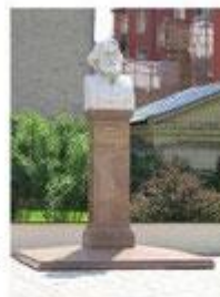
Бюст И. С. Тургеневу в Москве (открыт в 2003)