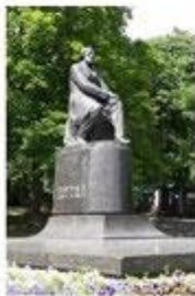
Памятник И. С. Тургеневу в Орле