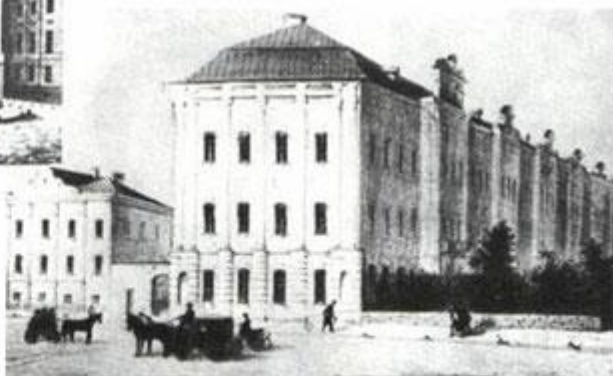
Петербургский университет. Литография. 1854 г.