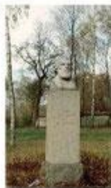
Памятник И. С. Тургеневу в Орле