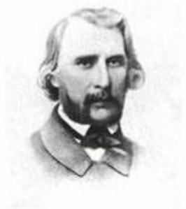
И. С. Тургенев. 1856 г.