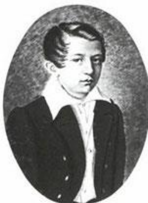
И. С. Тургенев

Гравюра М. Рошевского с фотографии В. А. Каррика. 1833 г.