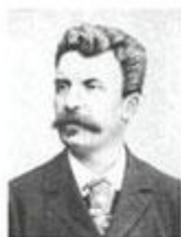
Ги де Мопассан