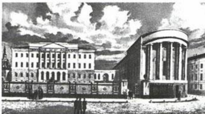
Московский университет. Новое здание. 1848 г. Акварель Г. И. Барановского

Тургеневу не было еще и пятнадцати лет, когда он, успешно сдав вступительные экзамены, стал студентом словесного отделения Московского университета.