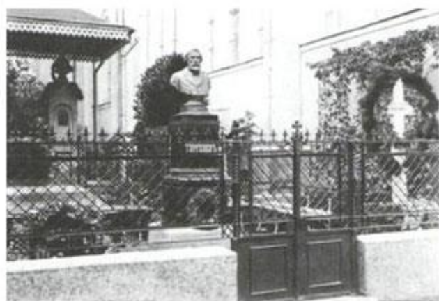
Могила И. С. Тургенева. на Волковом кладбище. Фотография