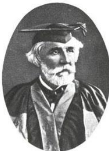
И. С. Тургенев в мантии доктора Оксфордского университета.