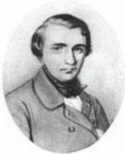
И. С. Тургенев. Акварель К. Горбунова, 1838 г.