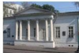
Музей И.С. Тургенева в г. Москва (ул. Остоженка, 37).