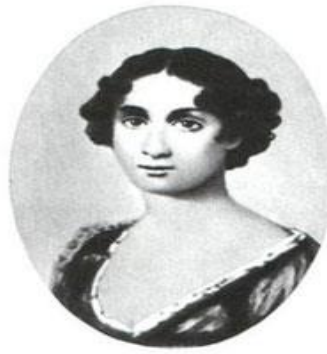
Варвара Петровна Тургенева, мать писателя. Портрет неизвестного художника