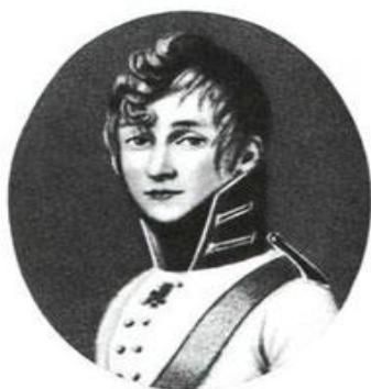
Сергей Николаевич Тургенев, отец писателя. Портрет неизвестного художника