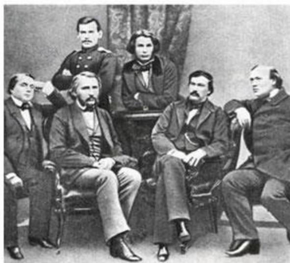
Группа сотрудников журнала «Современник». Слева направо сидят: И. А. Гончаров, И. С. Тургенев, А. В. Дружинин, А. Н. Островский; стоят: Л. Н. Толстой, Д. В. Григорович.