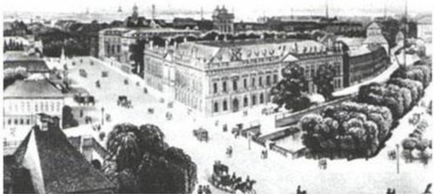
Берлинский университет. Литография. 1840-е гг.