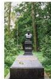
Надгробный бюст Тургенева на Волковом кладбище, Санкт-Петербург