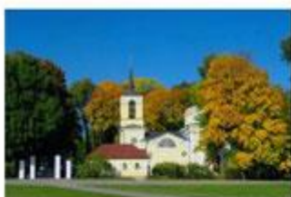
Государственный мемориальный и природный музей-заповедник И. С. Тургенева «Спасское-Лутовиново» (имение И. С. Тургенева в Орловской области)