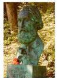
Памятник И. С. Тургеневу в Баден-Бадене