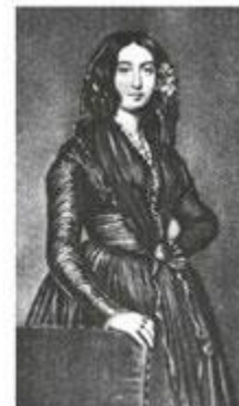
Жорж Санд Портрет Шарпантье