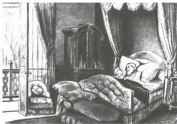
Больной И. С. Тургенев. Рисунок К. Шамро. 1883 г.