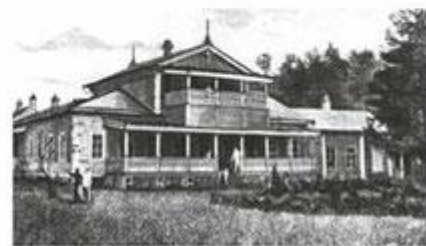
Главный усадебный дом в Спасском-Лутовинове.

Тургенев считал себя многим обязанным Орловщине, её природе и жителям.