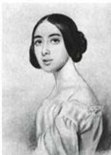
Полина Виардо. Акварель П. Соколова. 1843-1845

И. С. Тургенев – П. Виардо. 28 октября 1850 г.