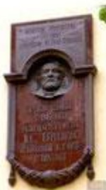
Памятная доска на здании музея И. С. Тургенева в Орле