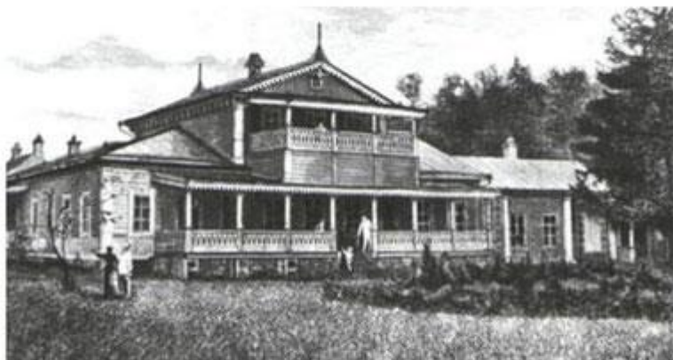
Главный усадебный дом в Спасском-Лутовинове. Гравюра М. Рашевского с фотографии В. А. Каррика. 1833 г.

В. Колонтаева. «Воспоминания о селе Спасском»