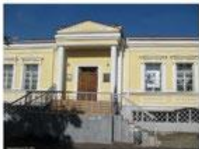
Государственный литературный музей имени И. С. Тургенева в г. Орёл (ул. Тургенева, 11).