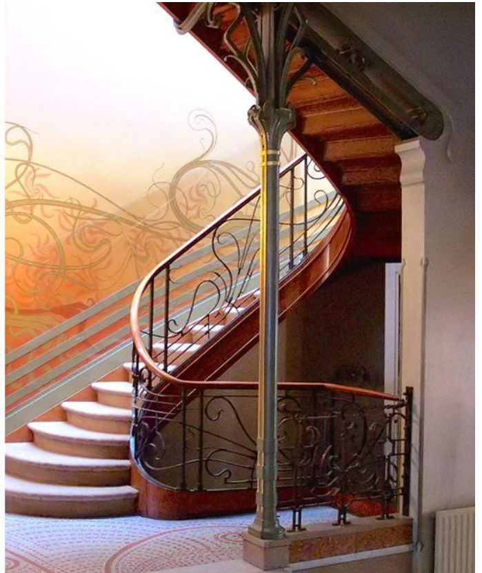
Брюссель, лестница в доме на ул. Турин. Балкон в стиле модерн

Для модерна характерны извивающиеся линии; в декоре его асимметричные арабески решительно порывают с традицией, создавая растительные мотивы (во Франции и в Бельгии) и линейные формы (в работах австрийских сецессионистов или шотландского арх. Чарлза Ренни Макинтоша).